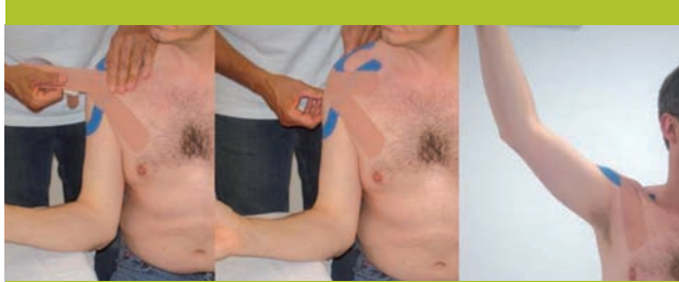
Figure 8. Postériorisation passive manuelle de la tête humérale, maintenue en place par une bande de correction

Le membre est placé en rotation externe maximale. La mobilité de l'épaule doit se faire dans l'amplitude maximale infradouloureuse.