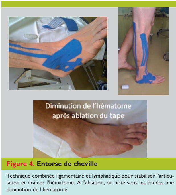
Figure 4. Entorse de cheville

Technique combinée ligamentaire et lymphatique pour stabiliser l'articulation et drainer l'hématome. A l'ablation, on note sous les bandes une diminution de l'hématome.